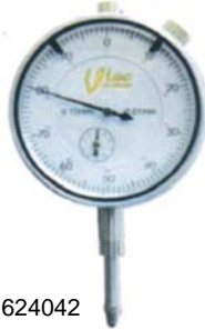
COMPARATORE VOGEL Ø 58x0,01