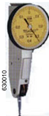
TASTATORE TESA Ø 28x0,01