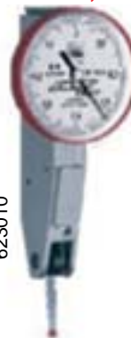
TASTATORE TESA SWISSTAST Ø 28x0,01