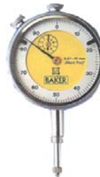
COMPARATORE BAKER Ø 58x0,01