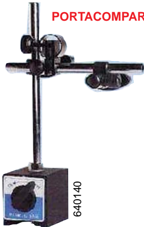
BASE MAGNETICA GMT PORTACOMPARATORI