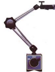
BASE MAGNETICA NOGA PORTACOMPARATORI