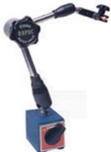
BASE MAGNETICA MICRON PORTACOMPARATORI