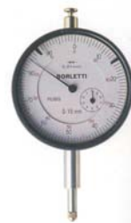
COMPARATORE BORLETTI SC61R Ø 60x0,01